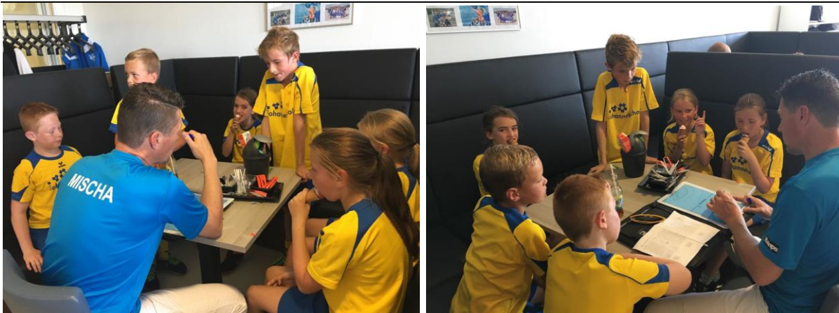
Een goede voorbereiding is natuurlijk het halve werk!